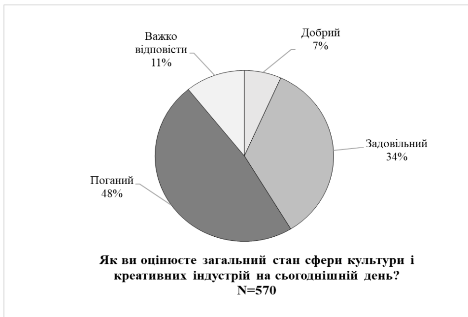
Рисунок 2 – Результати опитування УКФ [3]

Щоб вирішити ці проблеми за допомогою стратегічного управління, можна використати такі підходи: